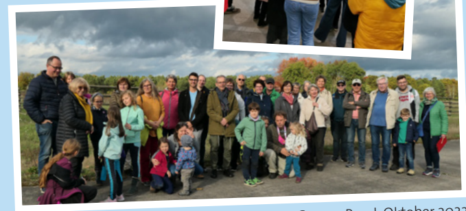
Campo Pond, Oktober 2022