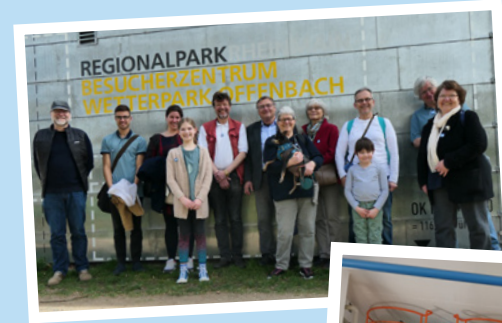
Wertterpark Offenbach, April 2022