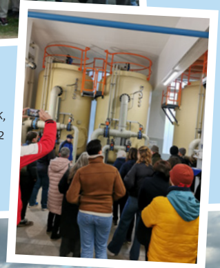
Wasserwerk, November 2022